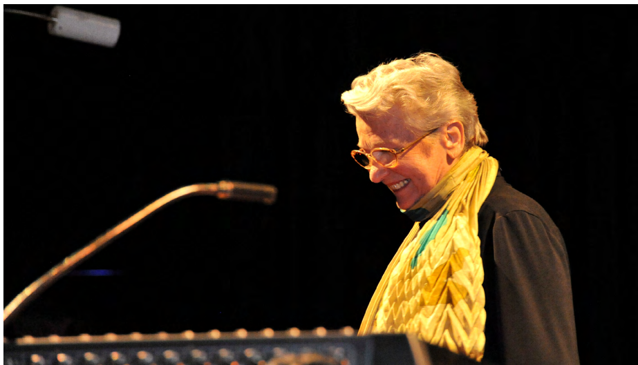
Eliane Radigue

Studio, Théâtre Marigny Carré Marigny, Paris 8 ème